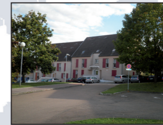
Devenir propriétaire ?