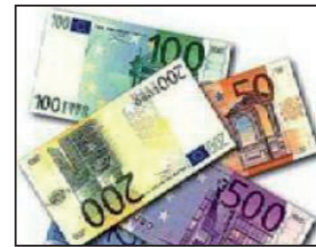
Les moyens de paiements