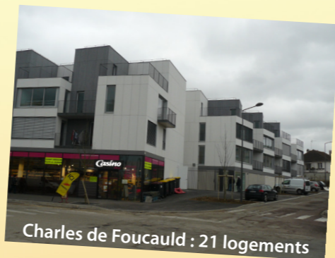
Charles de Foucauld : 21 logements