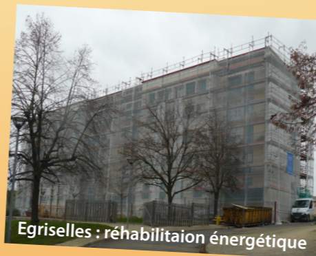
Egriselles : réhabilitation énergétique