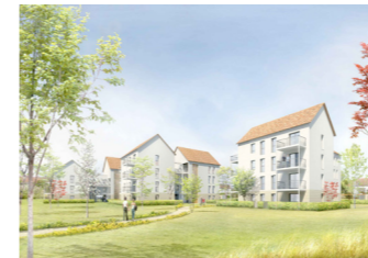
Developpement du patrimoine