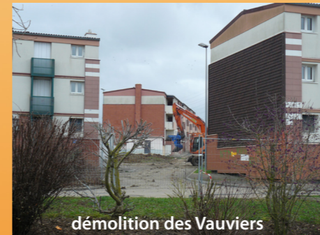
démolition des Vauviers