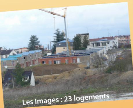
Les Images : 23 logements