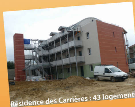
Résidence des Carrières : 43 logements