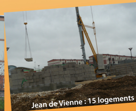
Jean de Vienne : 15 logements