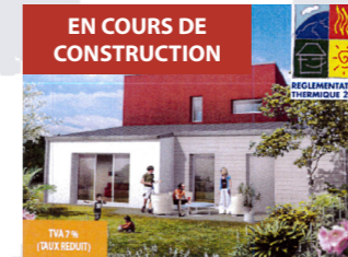
Devenir propriétaire ?