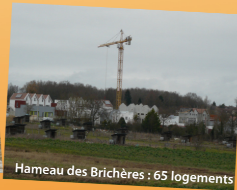
Hameau des Brichères : 65 logements