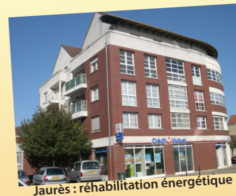
Jaurès : réhabilitation énergétique