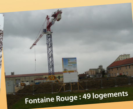
Fontaine Rouge : 49 logements