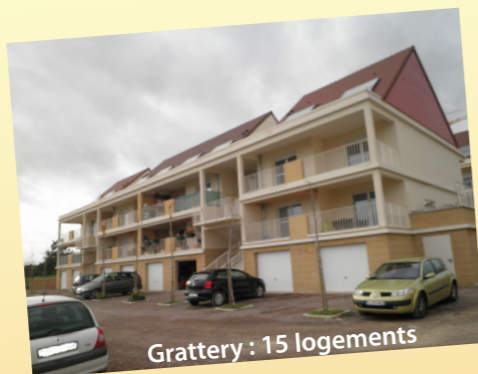
Grattery : 15 logements