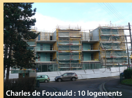
Charles de Foucauld : 10 logements