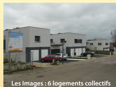
Les Images : 6 logements collectifs