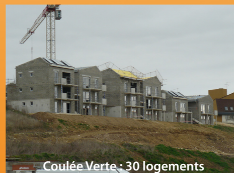
Coulée Verte : 30 logements

L'année 2013 s'est terminée avec la mise en location d'un total de 42 logements.