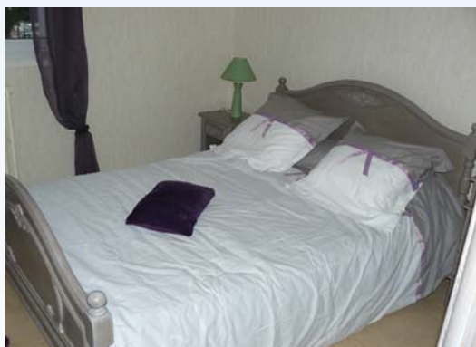
Atelier relooking : la chambre parentale terminée

1 er avril Atelier créatif sur le thème de Pâques avec le centre de loisirs Rive Droite. Date à définir : «Comment bien entretenir son balcon ou son jardin ?» avec la participation des services de l'OAH 29 mai : Fête des Voisins 13 au 21 juin : A l'occasion de la Semaine nationale des HLM : «85 ans de l'Office».