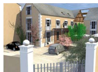
Les opérations nouvelles

Ce protocole pourra s'appliquer aux logements neufs à venir.