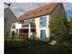
Devenir propriétaire ?