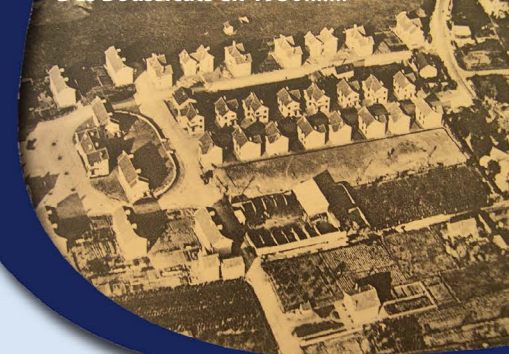
Des Boussicats en 1930.....