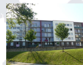
Egriselles a fait peau neuve