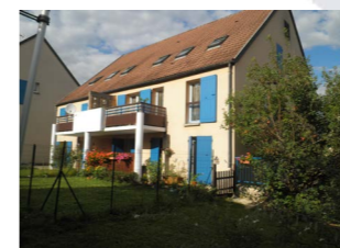
Devenir propriétaire ?

Résidence «Jean de Vienne» à Auxerre 7 maisons neuves de type 4 avec garage et jardin clos à partir de 173 900 €