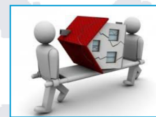
L'entretien de son logement