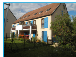
Devenir propriétaire ?