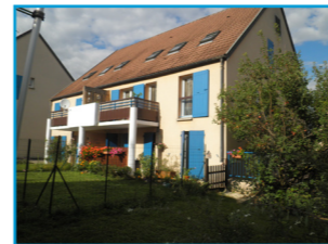
Devenir propriétaire ?