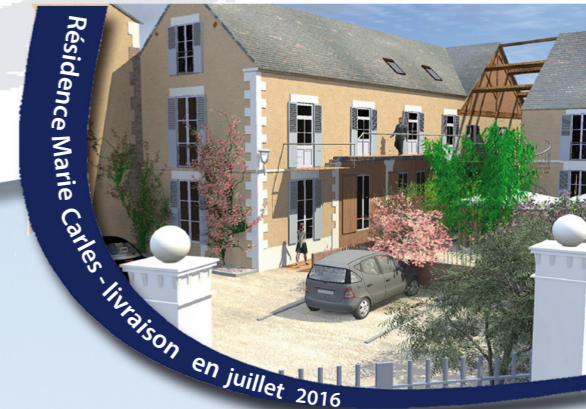
Résidence Marie-Carles - livraison en juillet 2016