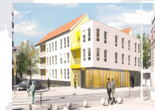
Les travaux en 2016