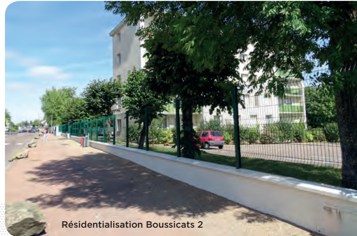
Résidentialisation Boussicats 2

Le budget de l'année 2018 se décompose en 2 parties :