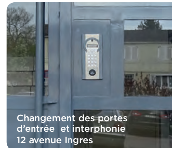
Changement des portes d'entrée et interphonie 12 avenue Ingres