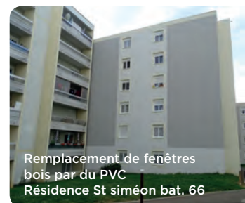
Remplacement de fenêtres bois par du PVC Résidence St siméon bat. 66