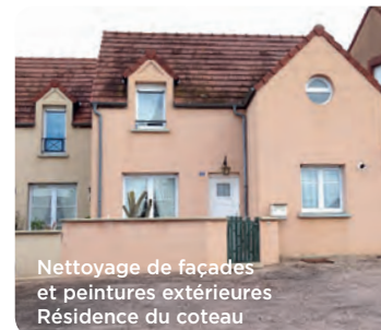
Nettoyage de façades et peintures extérieures Résidence du coteau