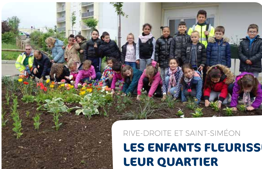
Les enfants de l'école primaire de Saint-Siméon.