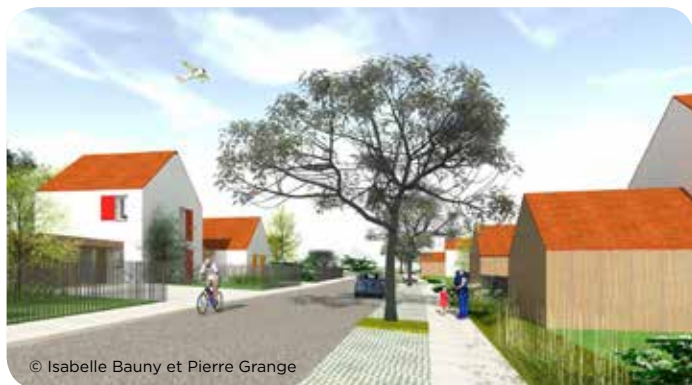
© Isabelle Bauny et Pierre Grange

Le projet trouvera sa place le long de la rue de Baulche, après la zone pavillonnaire, à gauche en direction de La Villotte.