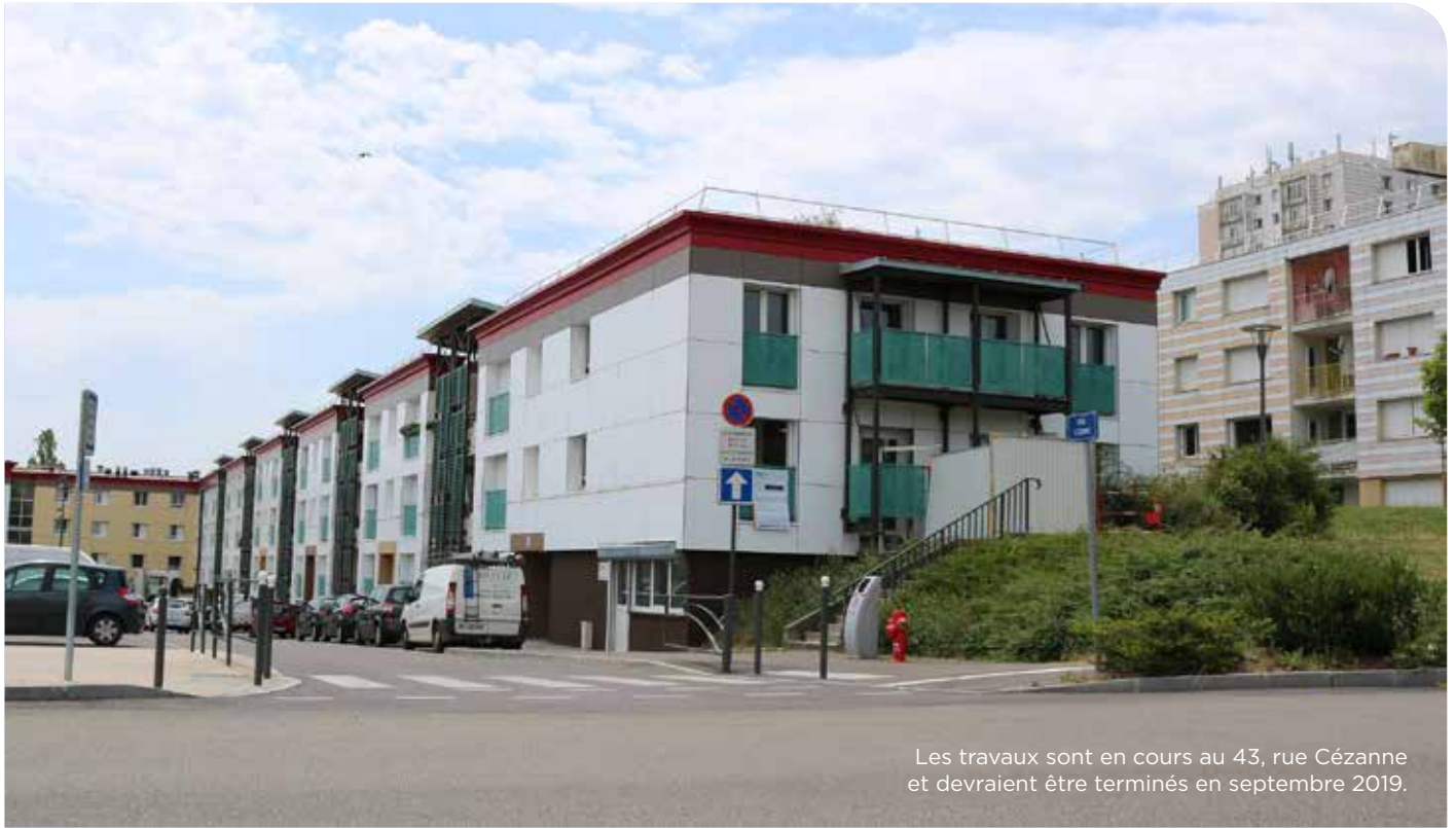
Les travaux sont en cours au 43, rue Cézanne et devraient être terminés en septembre 2019.

Depuis le début de l'année, des travaux ont été entrepris au 43, rue Cézanne, où s'installera, courant septembre prochain, la nouvelle agence Sainte-Genève de l'OAH. Ces travaux ont été programmés dans le but d'accueillir les locataires et demandeurs de logements dans de meilleures conditions.