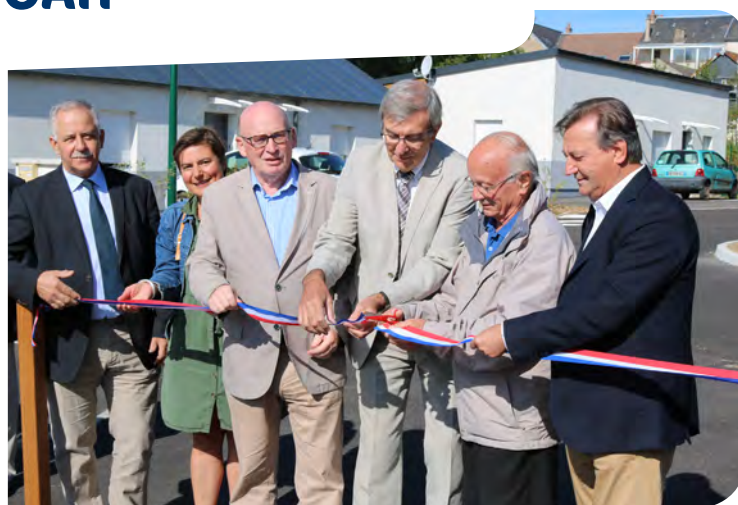
Lors de l'inauguration, le 6 septembre.

Le concept du Vill'Âge bleu permet à des personnes âgées de rester le plus longtemps possible chez elle. C'est le compromis idéal entre son domicile en toute autonomie et la maison de retraite. L'OAH en construit un deuxième actuellement, à Monéteau.