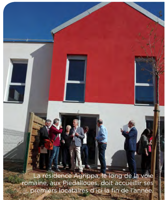
La résidence Agrippa, le long de la voie romaine, aux Piedalloues, doit accueillir ses premiers locataires d'ici la fin de l'année.

Au total, tous ces chantiers représentent un investissement de plus de 10,5 M€, les trois budgets les plus conséquents dans ces opérations étant consacrés à la rénovation du réseau de chaleur et à la construction des 34 logements (22 pour Agrippa et 12 pour Lambaréné).