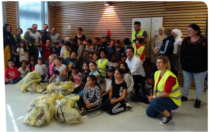
Les CE1-CE2 de Rive droite et de l'école de Brazza se sont mobilisés à l'initiative de l'agence Rive droite de l'OAH et de la maison de quartier.

Samedi 21 septembre, le World CleanUp day dans le quartier des Rosoirs.