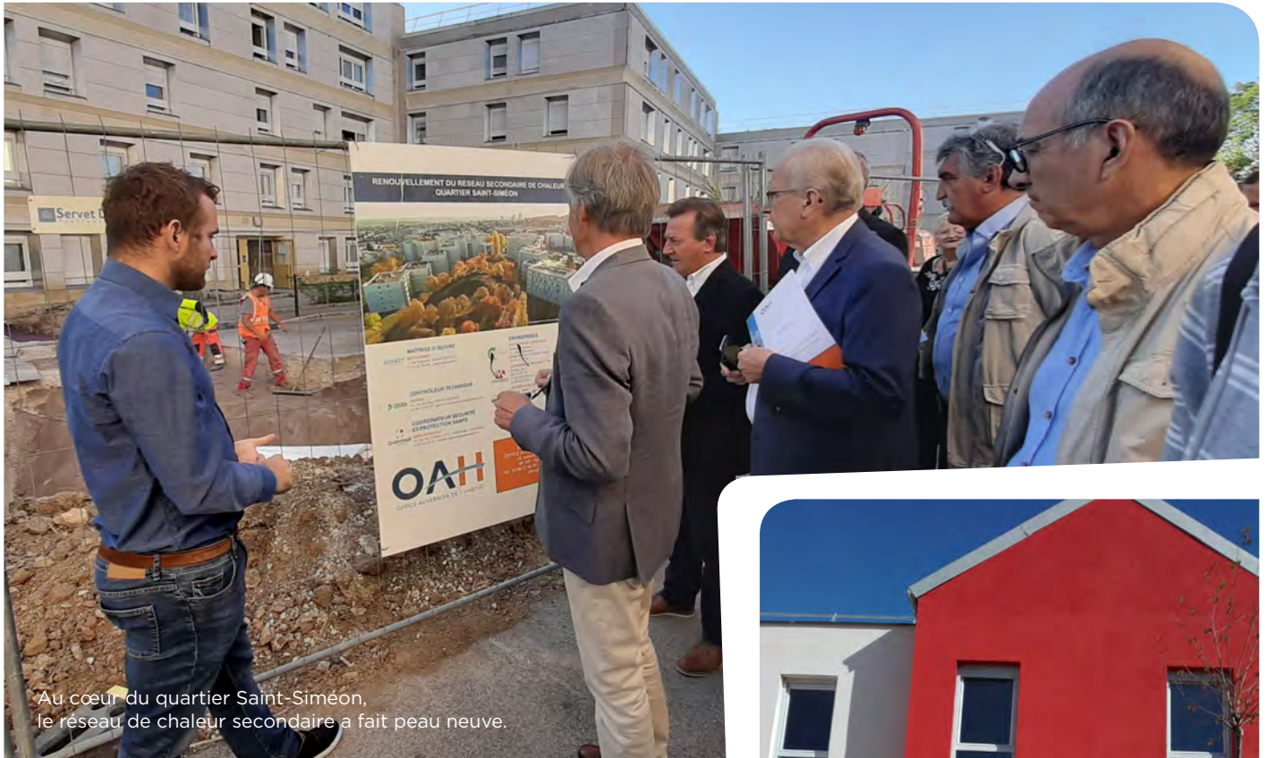
Au cœur du quartier Saint-Siméon, le réseau de chaleur secondaire a fait peau neuve.

Chaque année, en septembre, l'OAH fait aussi sa rentrée. Une rentrée consacrée à une partie de ses chantiers, qu'élus et administrateurs parcourent, le temps d'une matinée. Il s'agit de montrer concrètement à la délégation la nature des travaux et de constater leur état d'avancement.