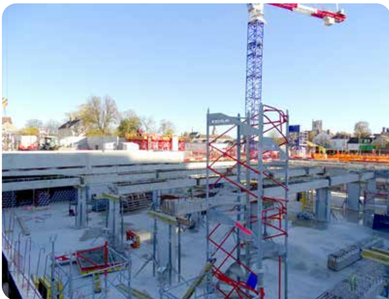
Fin novembre, la dalle du sous-sol était terminée. Le bâtiment C, lui, commençait à prendre forme.

Démarrés en juillet, les travaux de la future Résidence de la Porte de Paris avancent au rythme prévu malgré le confinement. Tout juste un ou deux jours de pluie en octobre ont-ils perturbé le chantier.