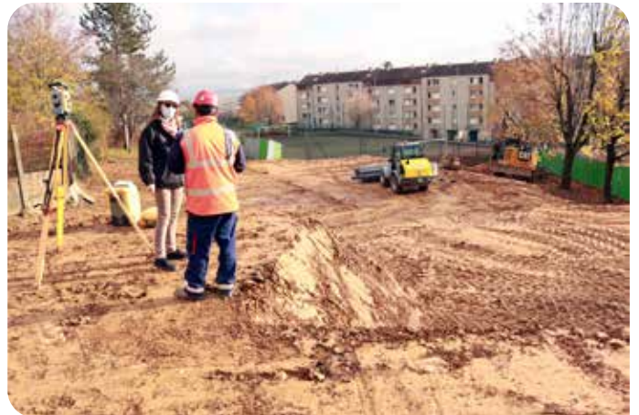
Les engins en action, fin novembre, lors de la phase de terrassement.

La livraison du chantier est prévue pour fin 2022.