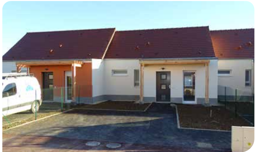
Deux des 20 pavillons individuels et de plain-pied du Vill'âge bleu de Monéteau, bientôt livrés.

Construite par l'OAH pour un montant de 3,1 M€, la résidence compte 14 logements T2 (49 m 2 ), 6 T3 (69,5 m 2 ), la salle commune de 49 m 2 ainsi qu'une chambre d'hôte de 17,7 m 2 afin de pouvoir accueillir amis et familles. Tous les logements disposent d'un jardin clos avec portillon et d'une place de stationnement. Conçus sur un seul niveau, ils sont traversants afin de bénéficier au maximum des apports solaires. La voirie qui dessert tous les pavillons implantés autour de la salle commune est en sens unique et dispose de places de stationnement libres. L'opération respecte les réglementations thermique RT2012 et accessibilité Personne à mobilité réduite (PMR).