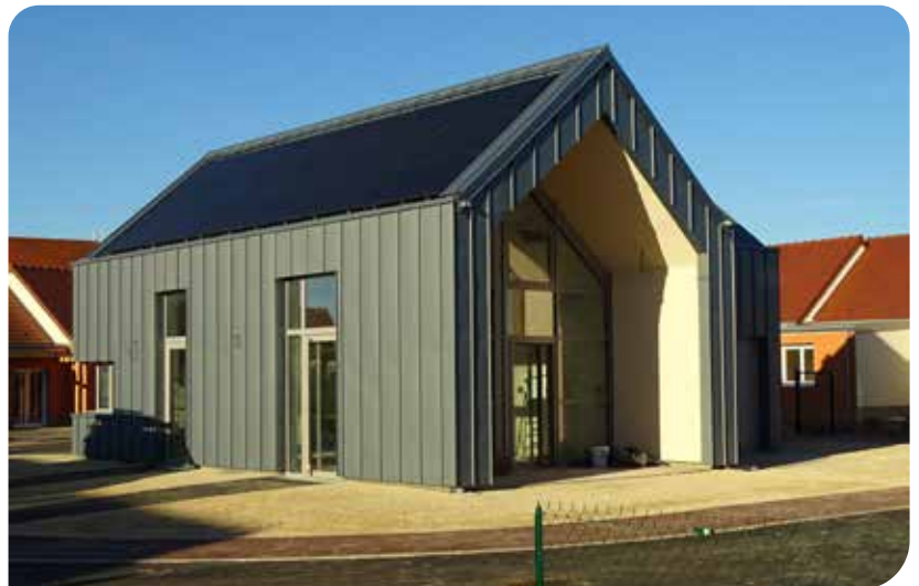
La salle commune où se dérouleront les animations collectives proposées par la Mutualité française bourguignonne.