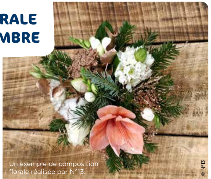
Un exemple de composition florale réalisée par N°13.

Les séances seront dirigées par le fleuriste N°13, situé au centre-ville d'Auxerre. L'objectif ? Que chaque participant confectionne sa propre composition florale sous les conseils avisés d'un professionnel. Les fleurs et supports sont fournis et l'atelier est gratuit.