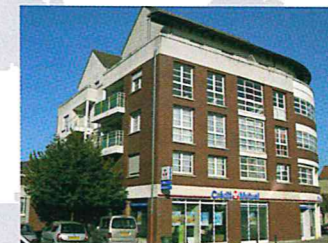
Devenir propriétaire ?