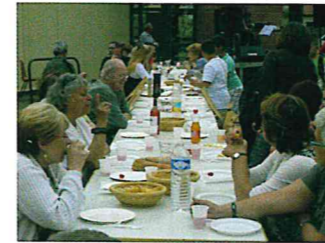
la Fête des Voisins