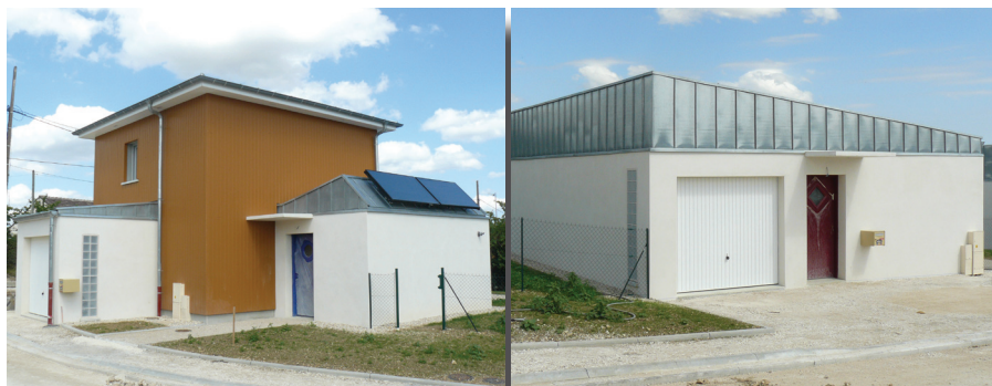
Pavillons en cours de construction, août 2010, avenue de la Grattery