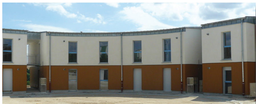
Collectif en cours de construction, août 2010, avenue de la Grattery