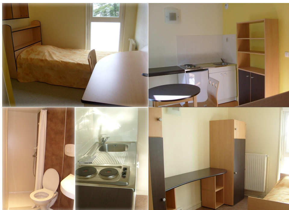
Les 20 studettes nouvellement aménagées sont toutes équipées d'un coin cuisine et d'une salle d'eau

Aménagement et embellissement des parties communes.