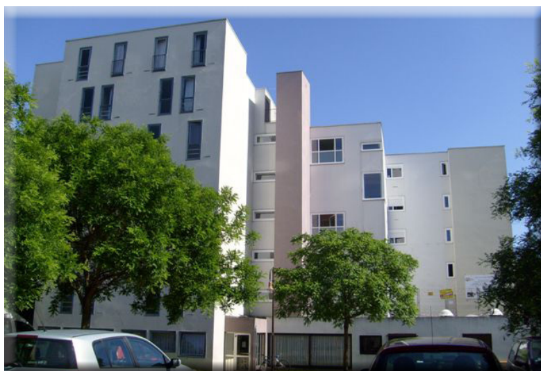
L'ensemble des chambres et studettes sera équipé de douche, lavabo et toilettes indépendants.

Cette opération de réhabilitation vise à la réfection et l'embellissement de 86 chambres ainsi que des parties communes du bâtiment et la création de 20 studettes, en 4 phases successives.